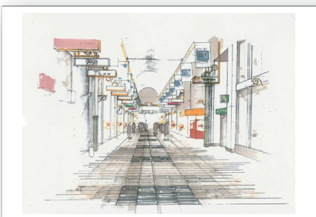
3丁目（東側）は桜色とグレーの御影石